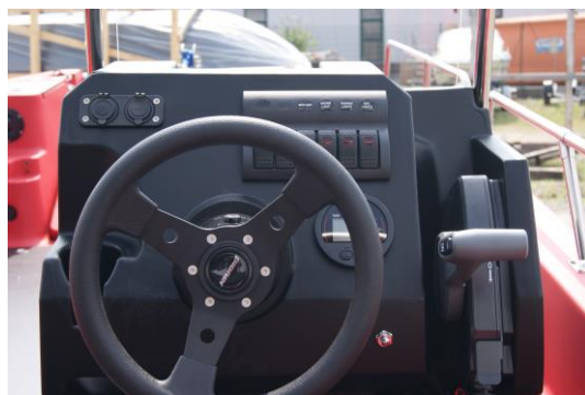
Steuerkonsole (klein) mit hydraulischer Lenkung