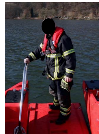
Hohe Tragkraft der Bugklappe (92 cm)