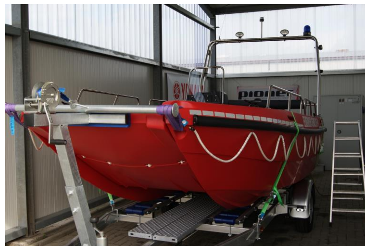
Multi III Spezial-Trailer