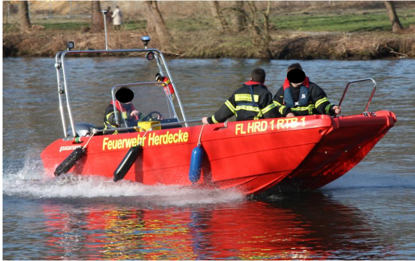
(Abbildung enthält Zubehörartikel)

by Matschke und Müller GmbH & Co. KG Telefon: +49 (0) 49 28 - 915 - 007 E-Mail: info@pioneer.de