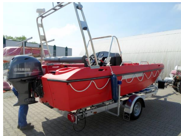
Geräteträger (groß, klappbar)