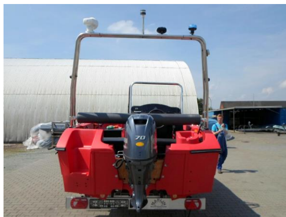
Geräteträger (groß, klappbar)

by Matschke und Müller GmbH & Co. KG Telefon: +49 (0) 49 28 - 915 - 007 E-Mail: info@pioner.de