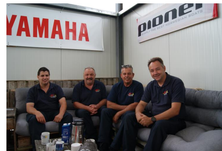
Übergabe und Einweisung

Preise inkl. Montage. Lieferung: Abholung oder per Spedition zzgl. Frachtkosten Änderungen und Irrtümer vorbehalten. Stand: 15.02.2022