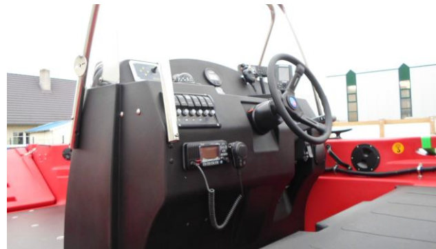
Steuerkonsole (groß) mit hydraulischer Lenkung