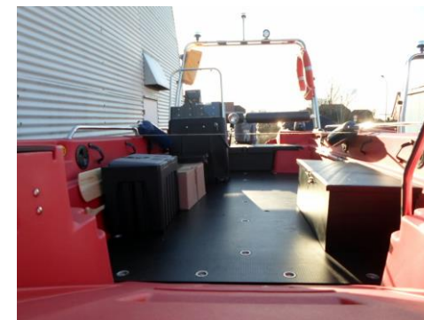
Extra-Sitzboxen f. 2 Personen