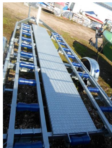
Multi III Spezial-Trailer