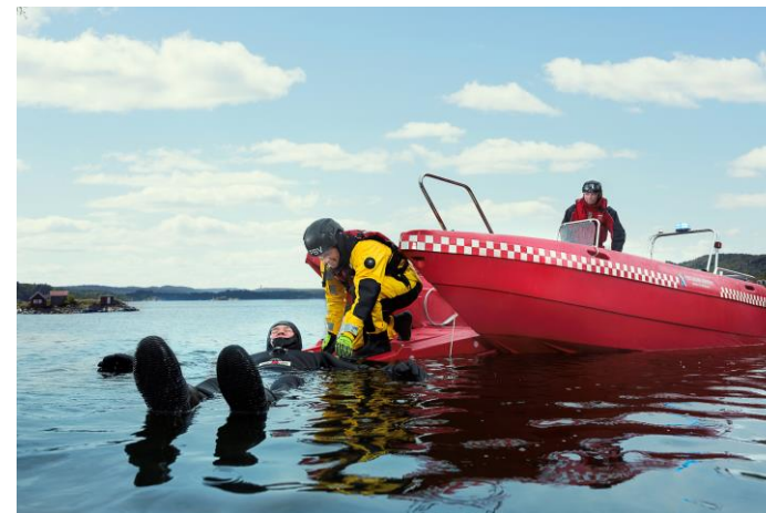
(Abbildung enthält Zubehörartikel)

inkl. inkl. inkl. inkl. (Preis auf Anfrage) inkl. inkl. inkl. inkl. inkl. inkl. inkl.